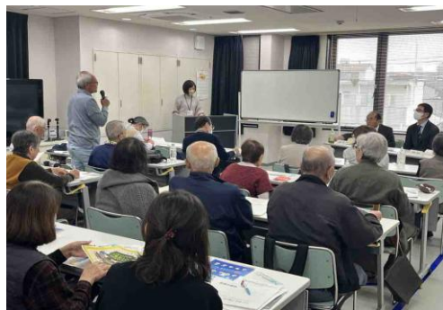
介護者からも積極的に質問がだされました

介護者自身が高齢になり、自分は大丈夫かという不安の声がありました。特にお金の管理にまつわるものが多かったので、司法書士を招き、成年後見制度の説明と事例を通した具体的な解説をしていただきました。参加者は、事前準備や対策がわかると少し安心されたようです。