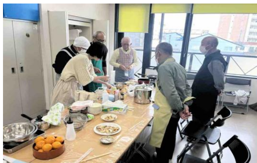
包丁の扱いや味付けなどを教え合います

日々の介護の中で、料理をしなければならないが、「料理の経験がない」「同じメニューばかりになる」といった悩みがありました。そこで料理の経験が豊富な会員がメニューを提案し、お互い教え合う形式の料理教室を開催しました。お買い物のポイントから下準備なども教え合って、3品を作りました。お酒のお供にもなるメニューで、参加者らはさっそく自宅でも作ったそうです。