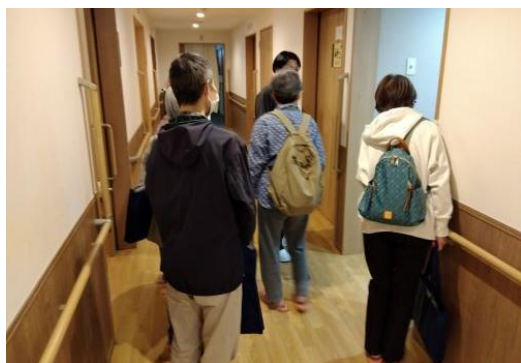
施設職員の案内で居室内も見学できました