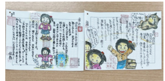
妻に向けた絵手紙