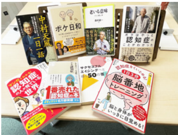
会員からの 推薦図書