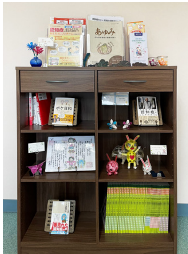
図書スペース設置!!