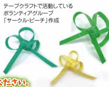
テーブルラフトで活動しているボランティアグループ「サークル・ビーチ」作成

シトラスリボンプロジェクトとは? コロナ禍で生まれた差別、偏見を耳にした愛媛の有志がつくったプロジェクトです。たとえウイルスに感染しても、だれもが地域で笑顔の暮らしを取り戻せる社会をつくりませんか? シトラス色のリボンなどを身に付けて「ただいま」「おかえり」の気持ちを表します。