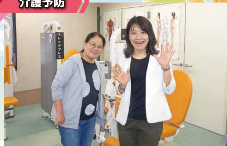
ふくおか あかし 福岡 明石

年齢を重ねても、自分らしくできる限り自立した生活を送っていただけるよう、地域の会館で集まり、毎月さまざまな催しを行っています。外出の機会を増やしたり、地域の方との交流にも最適です。65歳以上の方ならどなたでもご参加いただけます。