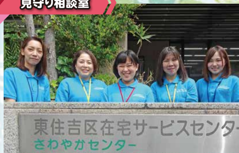
きよふじ きたがわ もり むらかみ うちだ 清藤 北川 森 村上 内田

日頃の見守り活動や地域のつながりづくりのため設置されており、お困りの方と地域や制度をつなげるパイプの役割を担っています。また、認知症高齢者等が行方不明になった場合の早期発見・保護につなげられるよう「見守りメール」の事前登録を受け付けています。