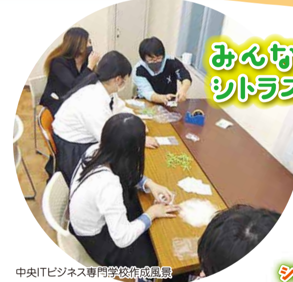
中央ITビジネス専門学校学校作成風景