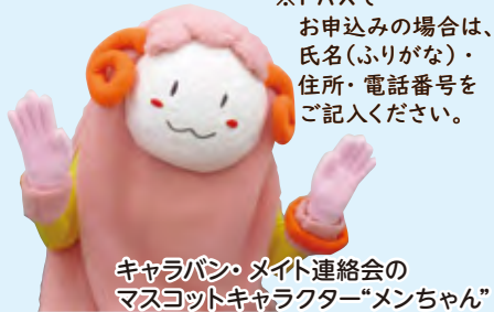
キャラバン・メイト連絡会の マスコットキャラクター「メンちゃん」